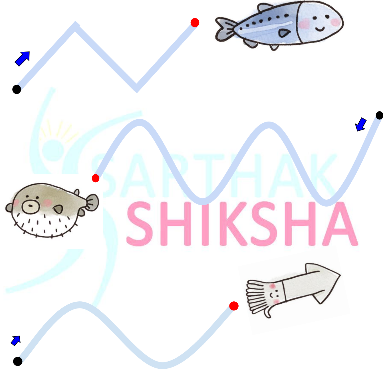
Illustration © irasuton (Takashi Mifune)

सिकाइ उपलब्धि : पूर्व लेखाइको अभ्यासले लेखन कार्यमा मद्दत गर्छ ।